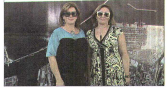
مالي بني ونشاميا تانكوزي