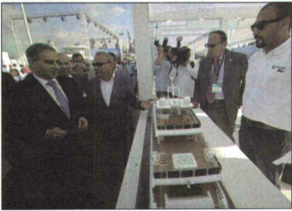
الوزير فرعون في المرفأ